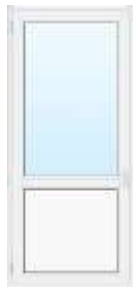
Таблица 8706-0302-01 - Балконные дверные блоки из ПВХ

-0103: Дверь балконная из ПВХ профилей толщиной 60 мм БП 21-5, остекленная однокамерным стеклопакетом, с поворотным устройством, с импостом.