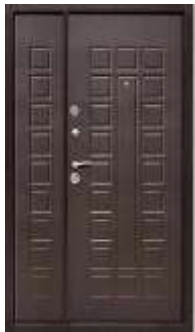
Таблица 8706-0201-04 - Дверные блоки наружные, двухпольные, усиленные, глухие блоки с трудновозгораемыми полотнами

-0402: Блоки дверные служебные с двухпольными трудновозгораемыми полотнами ДС 21-13ГТП с доводчиком дверным 4 класса.