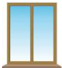
Таблица 8706-0101-03 - Оконные блоки из ПВХ профилей, двухстворчатые со стеклопакетом однокамерным, глухие

Блоки оконные из ПВХ профилей толщиной 60 мм двухстворчатые одинарной конструкции со стеклопакетом однокамерным, не открывающиеся: глухие, доски подоконные из ПВХ профилей.