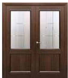
Таблица 8706-0202-04 - Дверные блоки двупольные во внутренних дверных проемах

Блоки дверные с двупольными глухими полотнами ДВГ 21-13П внутренние.