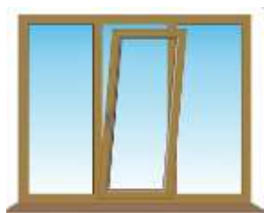
Таблица 8706-0101-06 - Оконные блоки из ПВХ профилей, трехстворчатые со стеклопакетом однокамерным, трехэлементные, с поворотной (откидной, поворотно-откидной) фурнитурой

Блоки оконные из ПВХ профилей толщиной 60 мм трехстворчатые одинарной конструкции со стеклопакетом однокамерным, с поворотной (поворотно-откидной) фурнитурой: трехэлементные - с одной поворотной створкой, доски подоконные из ПВХ профилей не ламинированные.