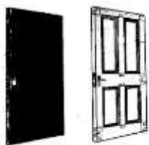
Таблица 8706-0201-03 - Дверные блоки наружные, однопольные, глухие блоки с трудновозгораемыми полотнами

-0301: Блоки дверные наружные, однопольные, глухие блоки с трудновозгораемыми полотнами ДС 16-9ГТП; ДС 19-9ГТП.