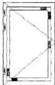
Таблица 8706-0204-01 - Дверные блоки из ПВХ в наружных и внутренних дверных проемах в перегородках

-0101: Блоки дверные из ПВХ профилей остекленные, однопольные, с заполнением однокамерными стеклопакетами.