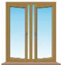
Таблица 8706-0101-04 - Оконные блоки из ПВХ профилей, двухстворчатые со стеклопакетом однокамерным, двухэлементные, с поворотной (откидной, поворотно-откидной) фурнитурой

Блоки оконные из ПВХ профилей толщиной 60 мм двухстворчатые одинарной конструкции со стеклопакетом однокамерным, с поворотной (поворотно-откидной) фурнитурой: двухэлементные с поворотно-откидными створками, доски подоконные из ПВХ профилей не ламинированные.