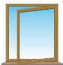
Таблица 8706-0101-02 - Оконные блоки из ПВХ профилей, одностворчатые со стеклопакетом однокамерным, одноэлементные, с поворотной (откидной, поворотно-откидной) фурнитурой

Блоки оконные из ПВХ профилей толщиной 60 мм одностворчатые одинарной конструкции со стеклопакетом однокамерным, с поворотной (поворотно-откидной) фурнитурой : одноэлементные поворотные, доски подоконные из ПВХ профилей не ламинированные.